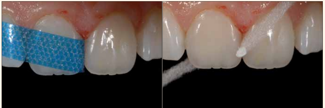
Figura 23A y 23B. Pulido interproximal con las tiras Epitex (GC) y la pasta Enamelize y Super-Floss (Oral-B).

El reto de la restauración radica no sólo en encontrar el color adecuado, sino que también conlleva un equilibrio entre la translucidez y la opacidad. El objetivo de este caso clínico es presentar, paso a paso, la reconstrucción directa de dos incisivos centrales superiores fracturados utilizando el sistema Amaris (VOCO). Para ello, se hace especial hincapié en el concepto de estratificación con resinas compuestas, tanto en el acabado como en el pulido, con el fin de lograr naturalidad en las restauraciones. ■