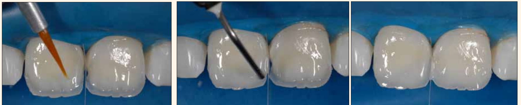
Figura 11. Aplicación selectiva de Amaris Flow HO sobre las puntas de los mamelones dentinarios para lograr un tono más intenso.