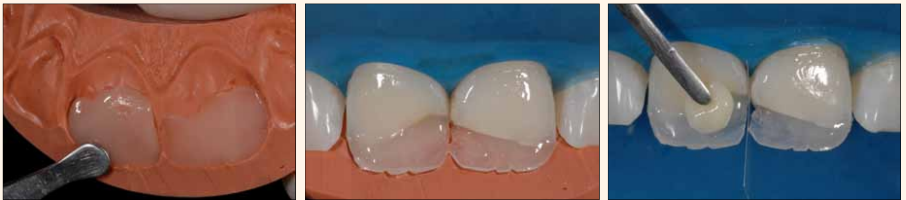
Figura 8. Colocación de un incremento de esmalte Amaris TN en la guía de silicona.