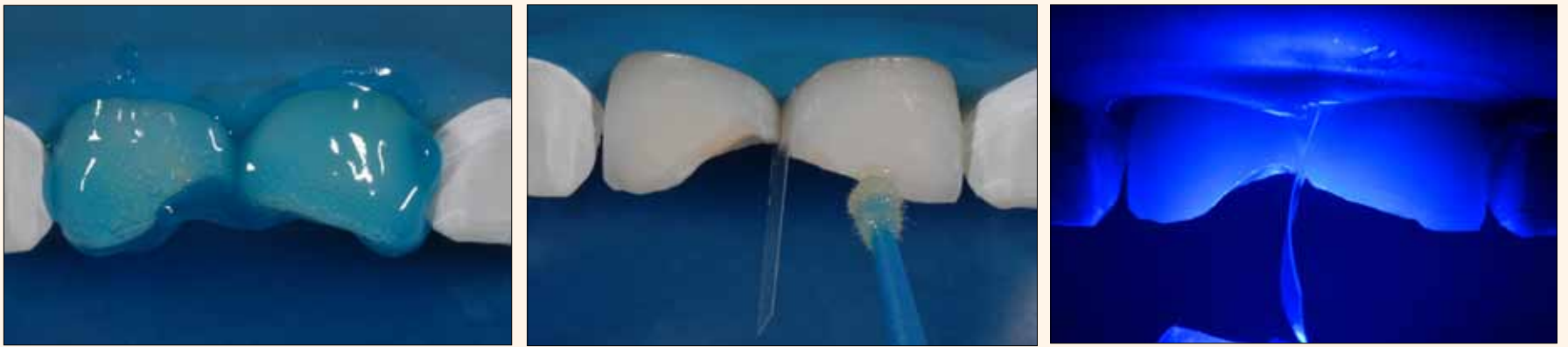
Figura 7A, 7B y 7C. Condicionamiento ácido total, aplicación del adhesivo en dos etapas Solobond M (VOCO) y fotopolimerización durante 15 segundos en cada diente.