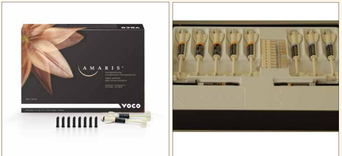
Figura 4A y 4B. Sistema Amaris (VOCO) utilizado para la restauración.