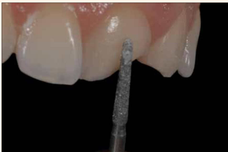
Figura 5. Confección de bisel con puntas de diamante 4138 (KG Sorensen)..