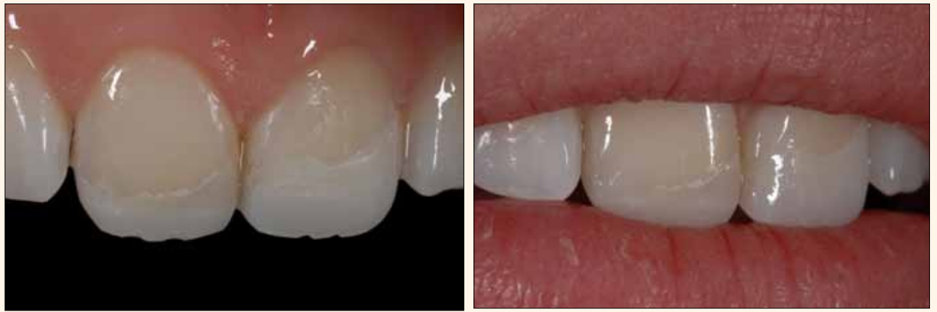
Figura 2A y 2B. Simulación intraoral (mock up) sin condicionamiento de la sustancia dental dura, que reproduce la longitud y el contorno de los dientes con el fin de evaluar la estética y la fonética.

El éxito clínico y estético de las restauraciones con resinas compuestas viene condicionado por dos requisitos fundamentales: el conocimiento de las propiedades ópticas de los dientes naturales y el conocimiento por parte del profesional del sistema de restauración adoptado. Cuando el clínico domina estos dos factores, es capaz de reconocer qué resinas compuestas hay que utilizar y con qué espesor incremental para poder imitar con naturalidad las características del diente a restaurar.