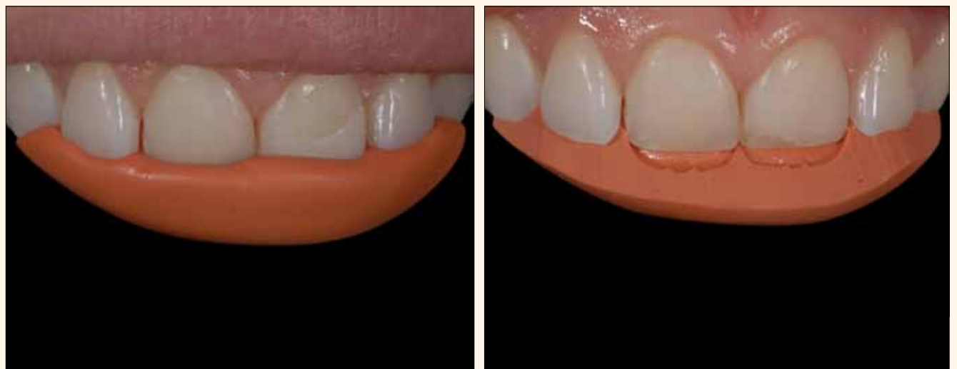
Figura 3A y 3B. Molde del mock up con silicona pesada y confección de la llave de silicona.