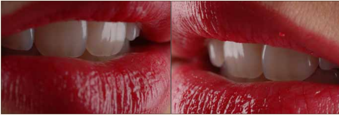
Figura 25. Resultado estético final.