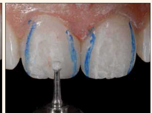
Figura 20A, 20B y 20C. Confección de la micromorfología vertical (depresiones longitudinales en las superficies vestibulares) con las puntas de diamante 2134 y 1015 (KG Sorensen) y en el contraángulo multiplicador T2 Revo (Sirona).