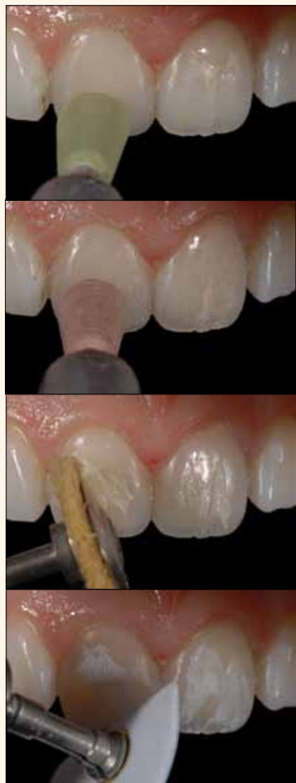
Figura 22A, 22B, 22C y 22D. Establecimiento del brillo final de la superficie con los discos verde y rosa Astropol (Ivoclar Vivadent), la pasta diamantada Diamond Excel (FGM) y el cepillo de pelo de cabra, así como la pasta Enamelize (Cosmedent) y el filtro Flexi Buff (Cosmedent).