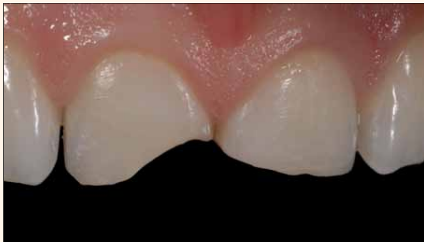
Figura 1. Dientes 11 y 21 fracturados.

En los dientes naturales el elemento que modula el color de la dentina y determinante del color es la dentina 1 . El esmalte actúa como un filtro que suele aumentar la calidad estética del diente.