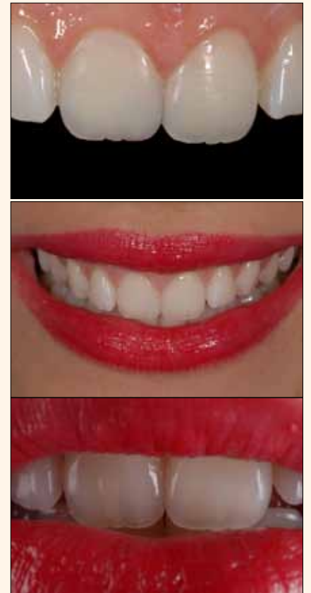
Figura 24A, 24B y 24C. El resultado estético final muestra la naturalidad, la armonía y la belleza de los dientes, así como la sonrisa de la paciente.