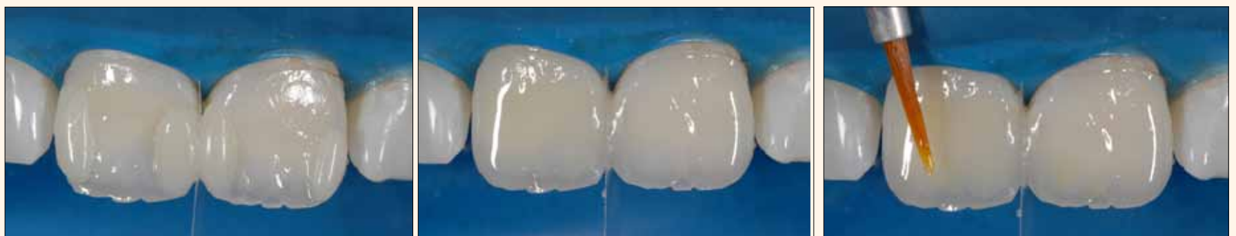
Figura 13A y 13B. Crestas proximales esculpidas con el esmalte Amaris TL.