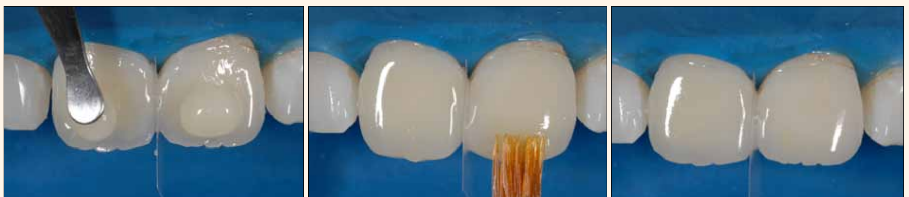
Figura 15A, 15B y 15C. Modelado de la capa final de esmalte de los dientes con ayuda de una espátula y alisado con un pincel Artist Line (Hot Spot Design).