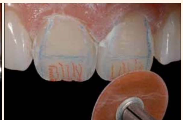
Figura 18A, 18B y 18C. Determinación de la forma básica de los dientes con área plana e inclinaciones de las superficies vestibulares mediante un disco abrasivo Sof-Lex Pop On (3M Espe).