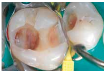
Caso de dolor: diente 16, 15 después de excavación