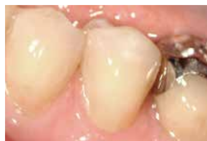
Diente 35 justamente después del tratamiento