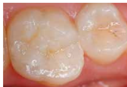
Tratamiento a continuación con Ionolux