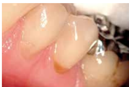
Diente 35 con defecto en el cuello del diente